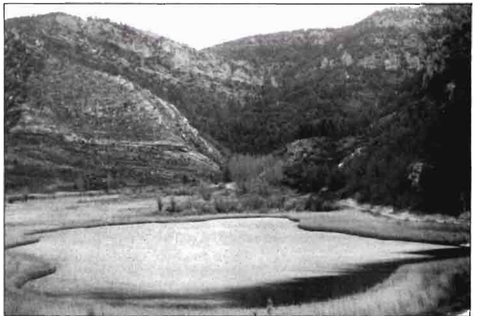
Laguna de Tarabilla. Uno de los elementos de oferta turística.

Todo ello justifica un modelo de desarrollo apoyado: