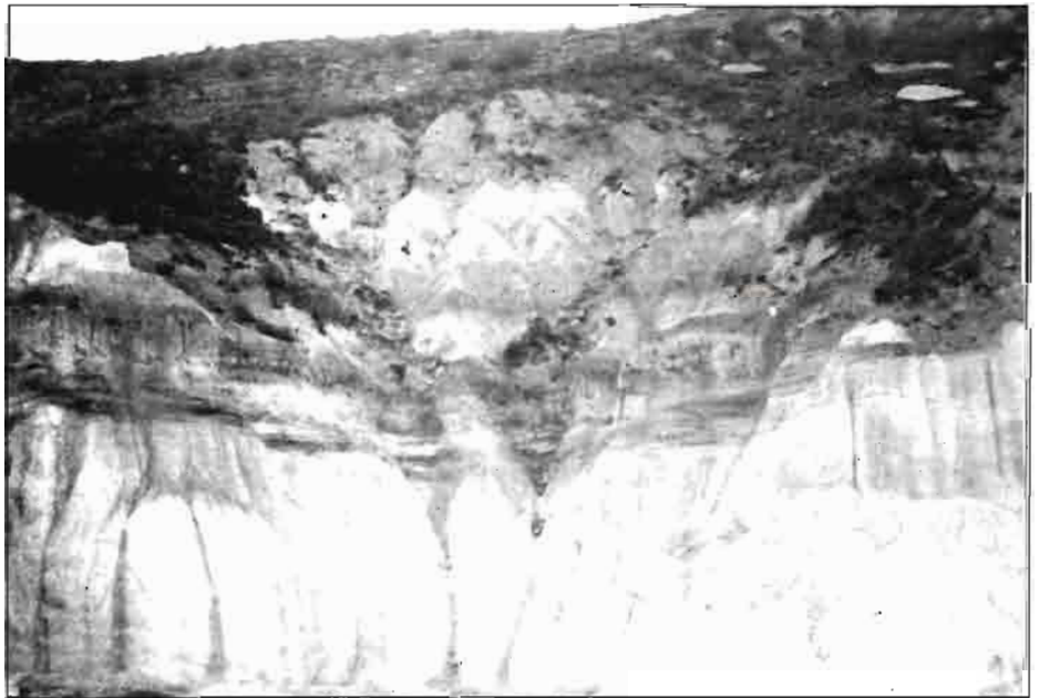
Las minas de Caolín. Un riesgo de degradación, no compensado por la creación de empleo y riqueza.

Estas actividades alternativas se beneficiarían de las ayudas comunitarias existentes tanto dentro del capítulo agrario cuanto, y muy especialmente, dentro de las destinadas a protección y conservación ambiental. A título de ejemplo se concretan a continuación algunas de ellas: