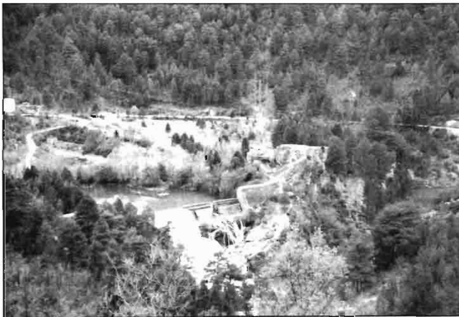
El tramo alto del Tajo, uno de los pocos ejemplos de aguas limpias en nuestro país.

— Elementos histórico artísticos, muy abundantes, entre los que destaca el re-