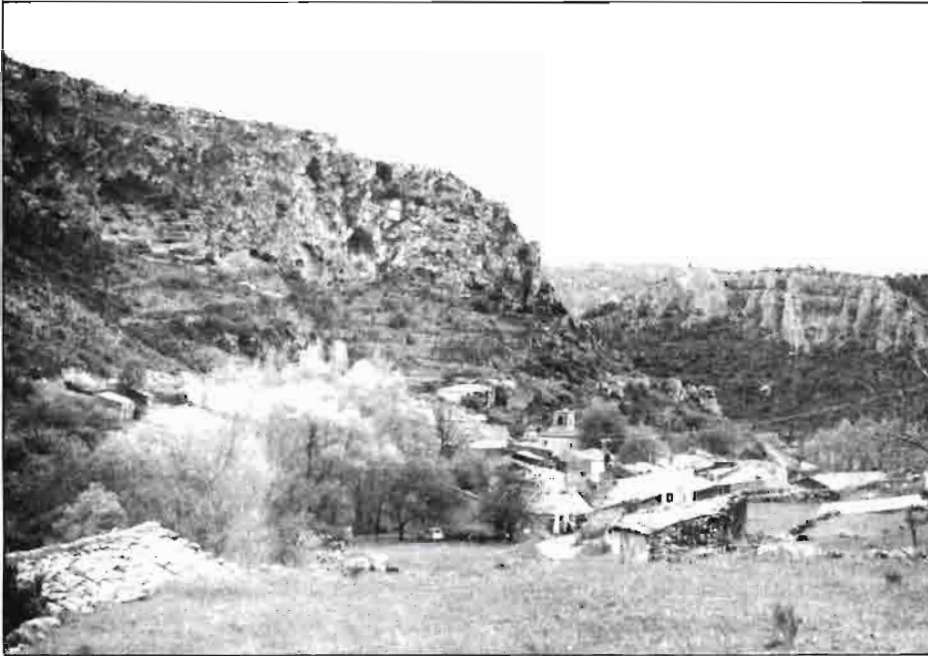
Huertahernando, privilegiado lugar en acusado declive poblacional.

ral es un sistema complejo, donde el tejido socioeconómico, con actividades muy diversas, se proyecta sobre un espacio geográfico que, además de un marco de vida y de producción primaria, cumple importantes funciones para el conjunto de la sociedad, tal como: